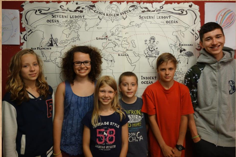
Vítězná skupinka Kocinson crew