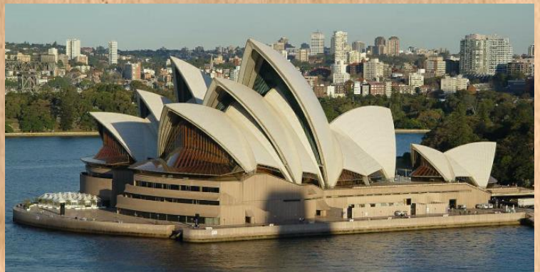
Opera v Sydney

Dnes můžeme očekávat teploty mezi 22°- 26°, oblačno, často však zataženo. Vítr mírný, jihovýchodní, místy čerstvý.