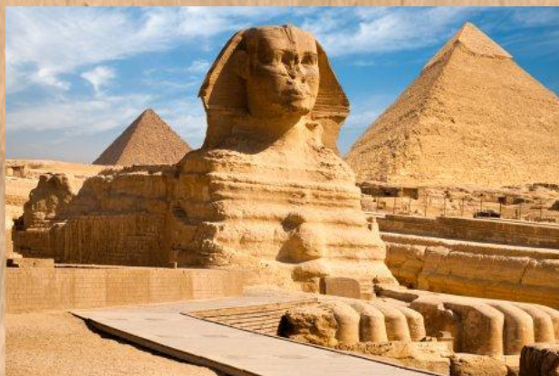
Velká sfinga v Gíze

Dnes můžeme očekávat teploty mezi 23°- 27°, polojasno, místy zataženo. Vítr mírný, jihovýchodní, místy čerstvý.